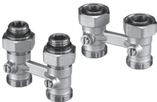
LV-KB прямой с присоединением к отопительному прибору G ½ и G ¾