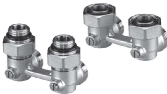
LV-KB угловой с присоединением к отопительному прибору G ½ и G ¾

Клапаны запорные типа LV-KB предназначены для применения в двухтрубных насосных системах водяного отопления с целью отключения отдельного отопительного прибора для его демонтажа или технического обслуживания без опорожнения всей системы. Не предназначены для контакта с питьевой водой в системах хозяйственно-питьевого водоснабжения.