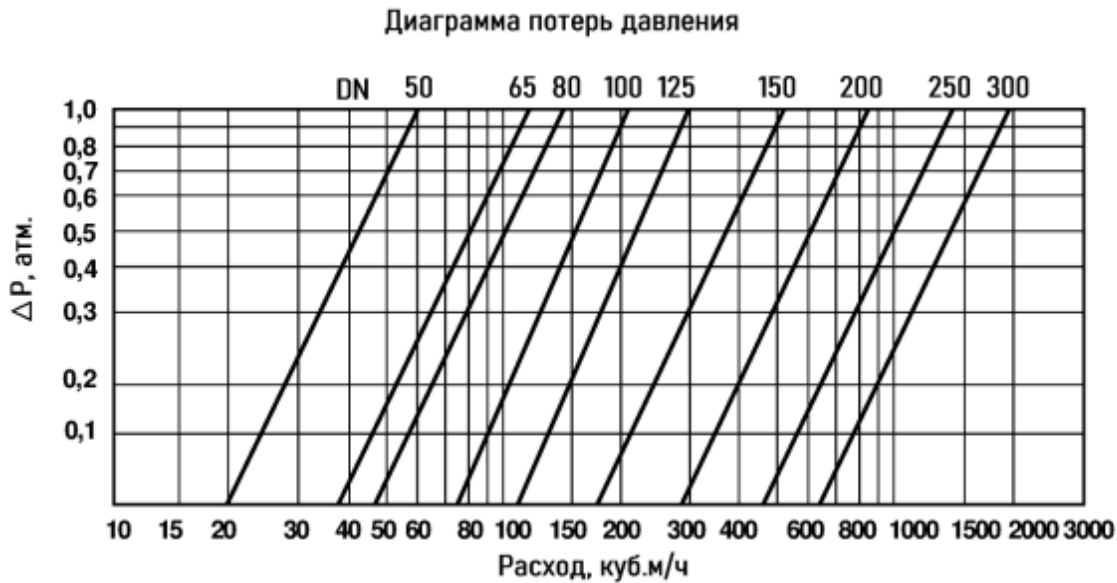
Диаграмма потерь давления в полностью открытом регуляторе

Потери давления при прохождении рабочей среды через регулятор могут быть определены по диаграмме: